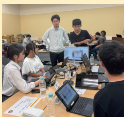
約4か月にわたり議論

中高生同士で「中高生にビジネスや起業に親しみを持ってもらおう」をテーマに議論し、中高生が生み出す、「アントレプレナーシップ育成計画」を知事に提案しました。