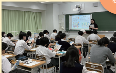
(東京都立永山高等学校)