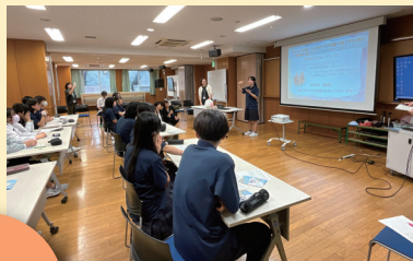
(東京都立中央ろう学校)