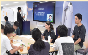
近未来の宇宙旅行を企画提案