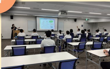
(東京都立八王子南特別支援学校)