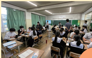
(足立区立谷中中学校)