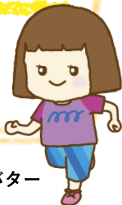
美波さんのアバター