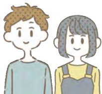
大学生、大学院生などの お兄さん・お姉さん